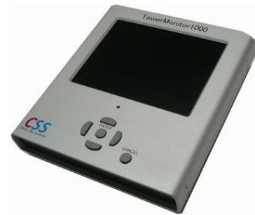
ネットワーク診断装置 TowerMonitor1000